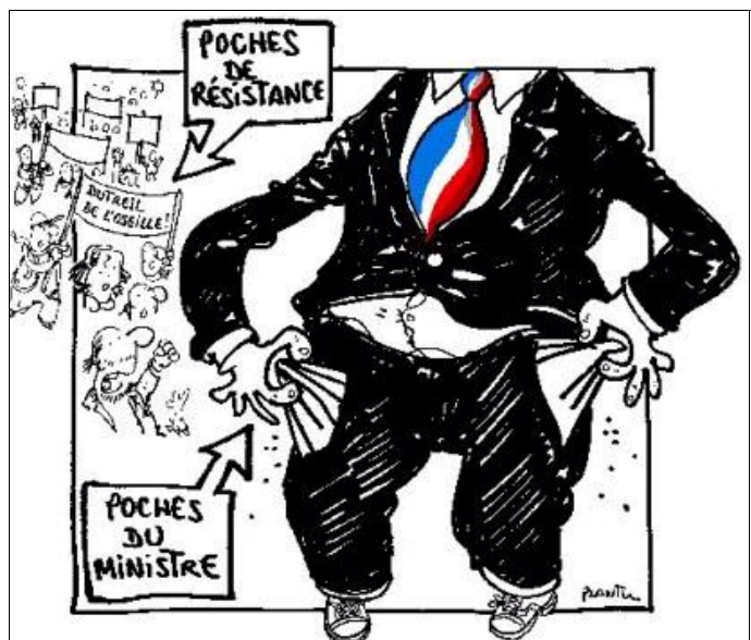
Tiré du journal « Le Monde » du 22 janvier 2005

Gains de Productivité? Autre formule pour dire « Travailler plus pour gagner plus ». Eh bien NON! : Que la richesse déjà créée rémunèrent des actions vraiment utiles pour la société!