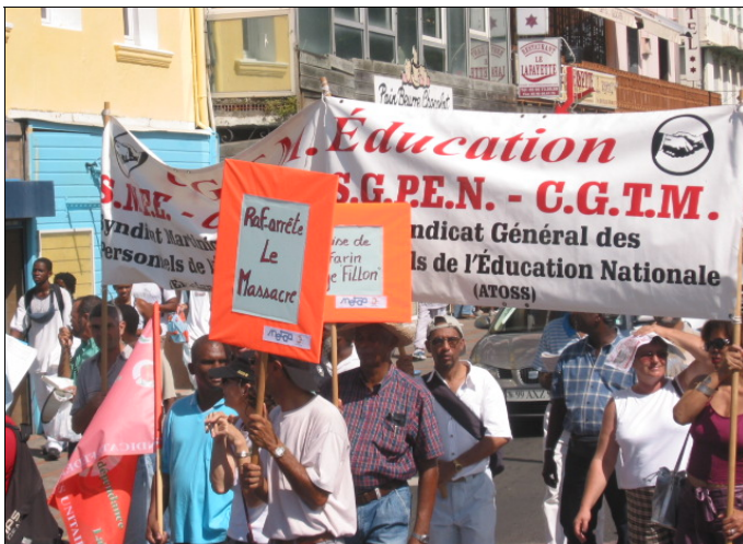
Fort de France, jeudi 20 janvier 2004

Renaud Dutreil avait misé sur un échec de la grève du 20. Raté. Il avait essayé de dissuader les travailleurs en rappelant que les jours de grève ne seraient pas payés. Il a été déçu.