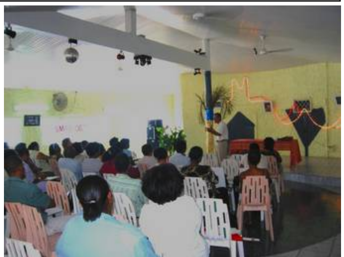
Thierry MICHALON intervenant le 4 avril 2003 sur le thème de la « Décentralisation et des transferts de compétences et de personnels aux collectivités »