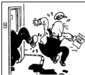
Dessin de Pessin extrait de « Le Monde »

« Le Chômage repart à la hausse » la Presse