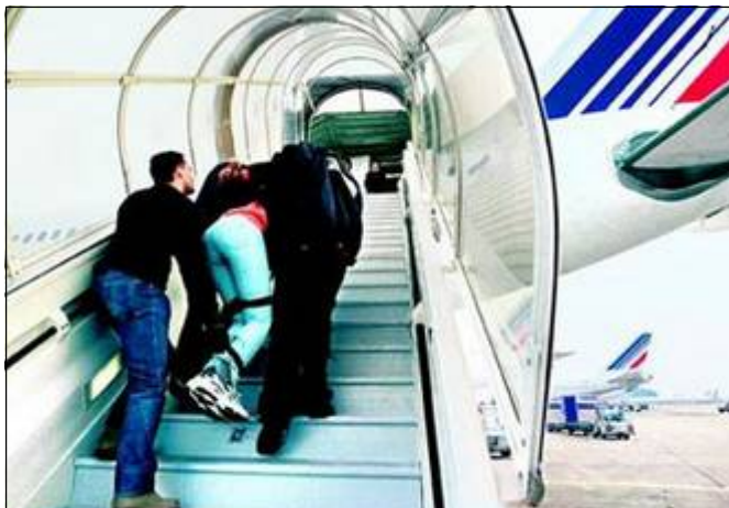
«Embarquement» d'un camerounais en 2004

Le candidat Sarkozy avait fait de l'immigration un des thèmes majeurs de sa campagne. Les électeurs qui ont délaissé le Front National pour lui accorder leurs suffrages ne sont pas déçus : la chasse à l'immigré en situation irrégulière est ouverte.